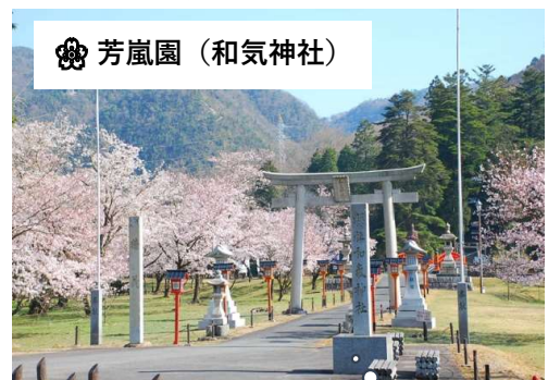
🌸 芳嵐園 (和気神社)

和気の桜の名所、芳嵐園！ 藤公園として4月下旬から5月上旬にかけて藤の花が有名で、GWは大渋滞ですが、桜の名所としても有名です☆園内は散策が可能なので、ゆっくりとお散歩気分です散策してみてくださいか??