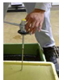
ベーンせん断試験