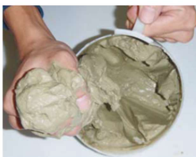
●クレーショック生成