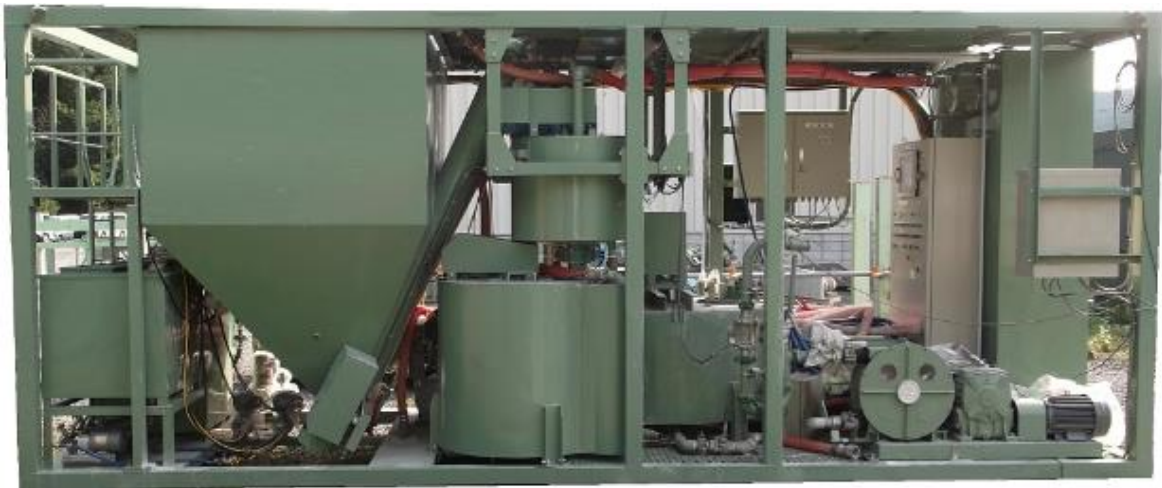
型式CSS-01 (寸法 L6.5m×W2.1m×H2.7m、電気容量 AC200V/25kW、空重量 5.3ton)

○ クレイショックスーパープラントは大型低床トラックに車上搭載可能なコンパクトなタイプです。